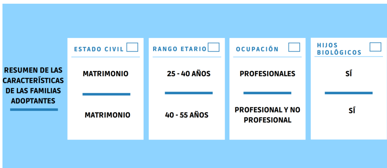
Infografía N°2: Resumen características de familias adoptantes.

Por otro lado, están las familias que han decidido adoptar a niños, niñas y adolescentes con discapacidad provenientes de SENAME o sus fundaciones asociadas entre los años 2014 y 2020, y que hayan dado su consentimiento para participar del estudio. Todo ello con el fin de conocer desde su perspectiva cómo se desarrollan los procesos y etapas de adopción, para compararlo con lo declarado por las instituciones. A continuación se presenta una tabla resumen que señala características de las familias entrevistadas.