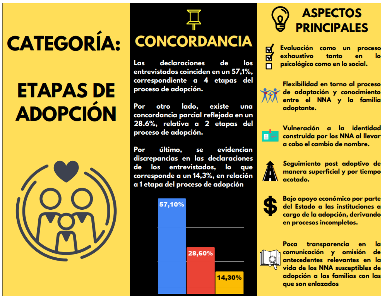
Infografía N°3: Resumen Categoría Etapas de Adopción.

Cabe destacar que, en cada una de las siguientes categorías se expone una infografía resumen con las mismas características.