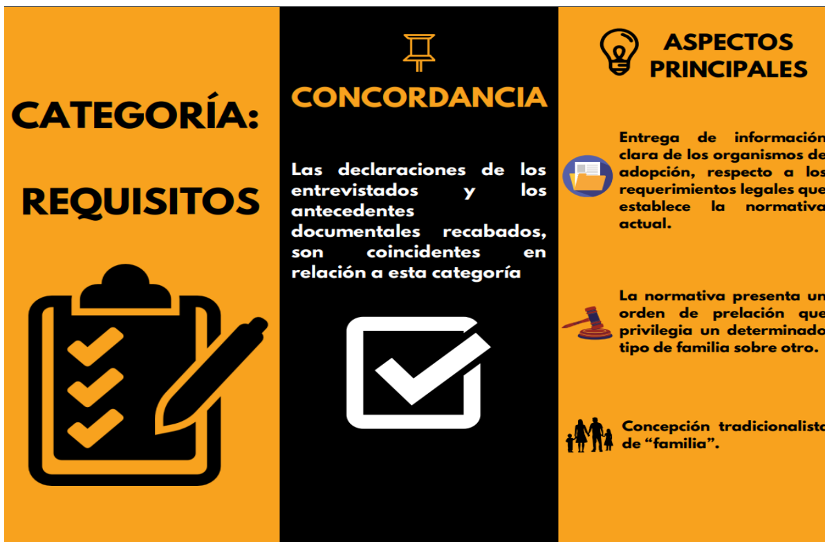
Infografía N°4: Resumen Categoría Requisitos

la prioridad es que dicho niño o niña se desarrolle en una familia con personas aptas para su cuidado, que cuentan con las herramientas y las habilidades para hacer frente a sus necesidades. A continuación, se presenta una infografía de resumen.