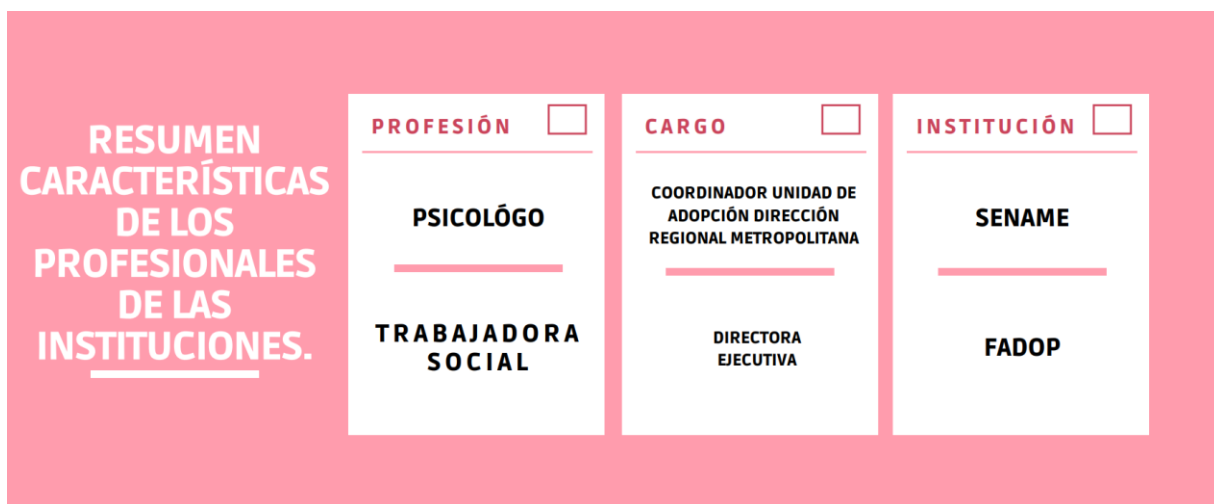
Infografía N° 1: Resumen características profesionales de las instituciones.