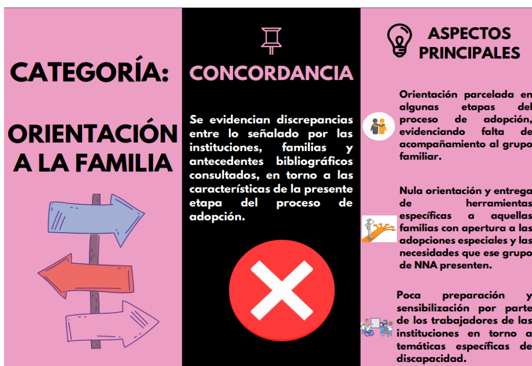
Infografía N°5: Resumen Categoría Orientación a la familia.

retos probablemente mayores y por ende necesitarán de una buena preparación y de una sólida contención por parte de especialistas, para así evitar fracasos en la adopción. En torno a esto, parece de gran relevancia la escasa preparación de los profesionales de las instituciones respecto a la temática de la discapacidad, en base a la información recogida, no se tienen los conocimientos suficientes para poder suplir las necesidades que surjan, ya sea de parte de los NNA como de las familias postulantes a la adopción. A continuación se presenta una infografía resumen.