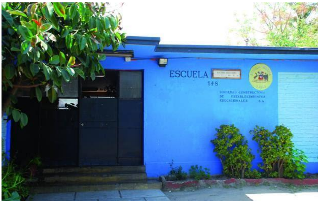
Escuela Víctor Cuccuini. Recoleta, Región Metropolitana de Chile