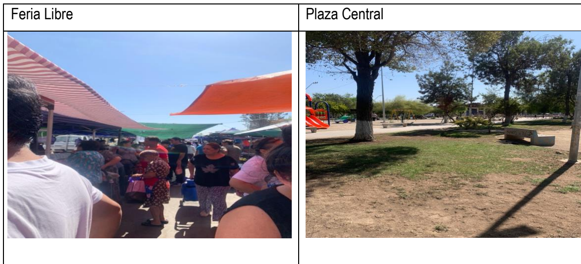
Figura 4. Espacios públicos de la Población Dávila

En las siguientes imágenes se pueden apreciar. En primer lugar, la feria. En este espacio, hay una importante diversidad de comercio local, donde primeramente los vecinos y vecinas hacen sus compras. Se ubicada entre las calles Melinka y Pirihueico, por Manuela Errázuriz, teniendo un recorrido de casi cuatro cuadras enteras. Como en toda feria, existen puestos legalmente establecidos, como también los famosos “coleros”, que son personas que se toman de una parte de la calle/vereda para vender sus productos, generalmente continúan la línea establecida por la feria. En la Dávila, los coleros son personas vecinas al sector.