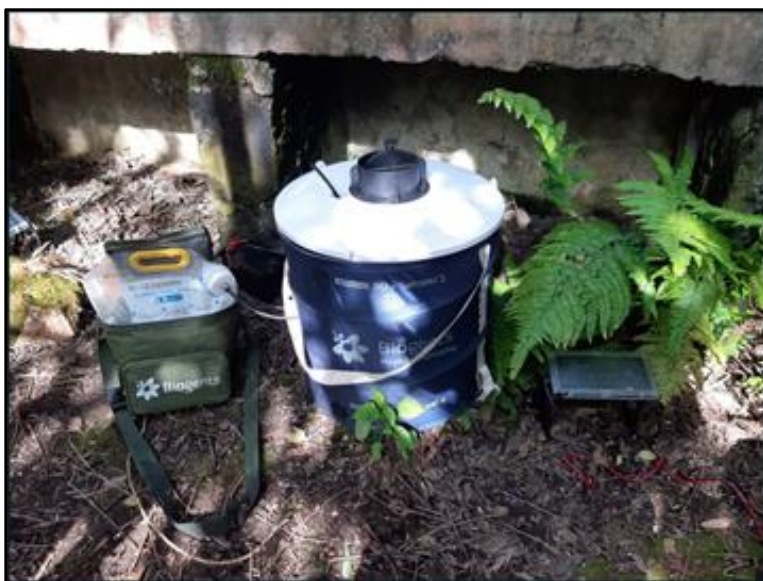
Figura 2. Trampa BG traps (con BG-CO 2 Powder), utilizada para la captura de ejemplares adultos de Ae. aegypti . Dispuesta en Terrenos abandonados de Vaitea.

Todos los ejemplares capturados en terreno, fueron almacenados en tubos tipo Falcon de 15ml-50ml, y/o en las cámaras de colecta dispuestas en las mismas trampas.