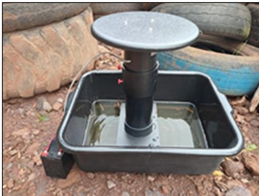
Figura 3. Trampa Frommer Updraft Gravid Trap, con infusión de hierbas como atrayente, para la captura de ejemplares adultos y grávidas de Aedes aegypti . Dispuesta en Centro de reciclaje de Orito.