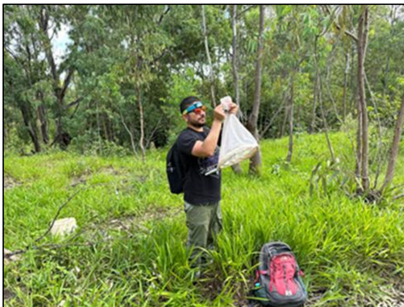
Figura 5. Captura de ejemplares adultos de Ae. aegypti con red entomológica en el sector de Vai Kirea, Rapa Nui.