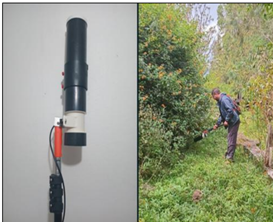
Figura 4. Colecta de ejemplares adultos de Ae. aegypti por medio de la Improved Prokopack Aspirator, en el sector de Vaitea, Rapa Nui.