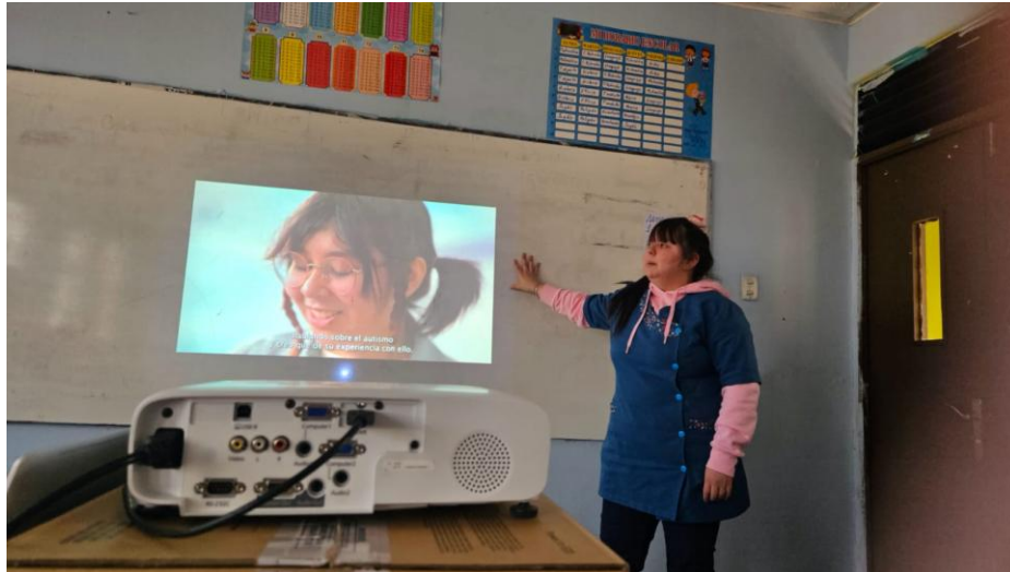
Imágenes de sala DEC y materiales utilizados para las diferentes sesiones.