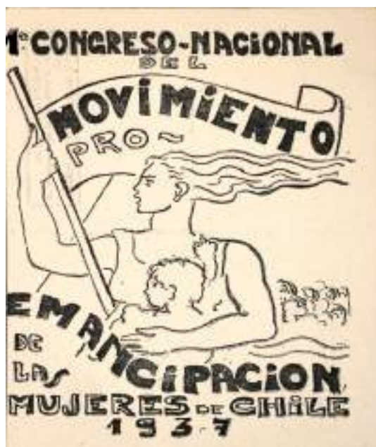
Figura 6. Afiche del Primer Congreso Nacional del Movimiento Pro Emancipación de las mujeres de Chile , 1937, creado por Laura Rodig.

Es durante este mismo período que Rodig diseñó la imagen e ícono del MEMCH, que luego se usaría en el estandarte oficial. Fue colaboradora de La Mujer Nueva , publicación del movimiento, donde se discutieron y difundieron las demandas sociales de la población femenina. (Museo Nacional de Bellas Artes). Entre las problemáticas abordadas encontramos “el voto femenino, el derecho a la lactancia materna de las obreras, el aborto y el problema de la mortalidad infantil” (Cortés, 2020, p.23).