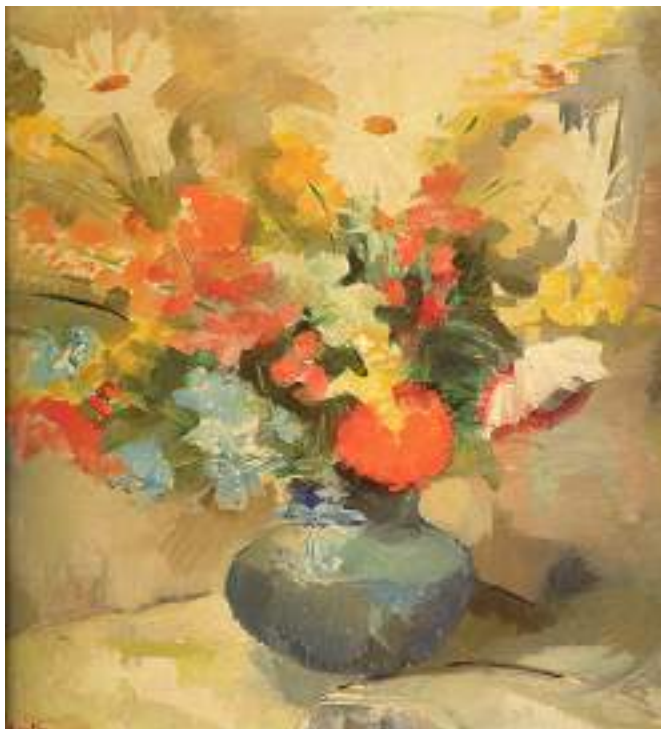
Figura 13. Ana Cortés, Flores (s.f). [Pintura al óleo]. Pinacoteca del Banco Central de Chile, Santiago.