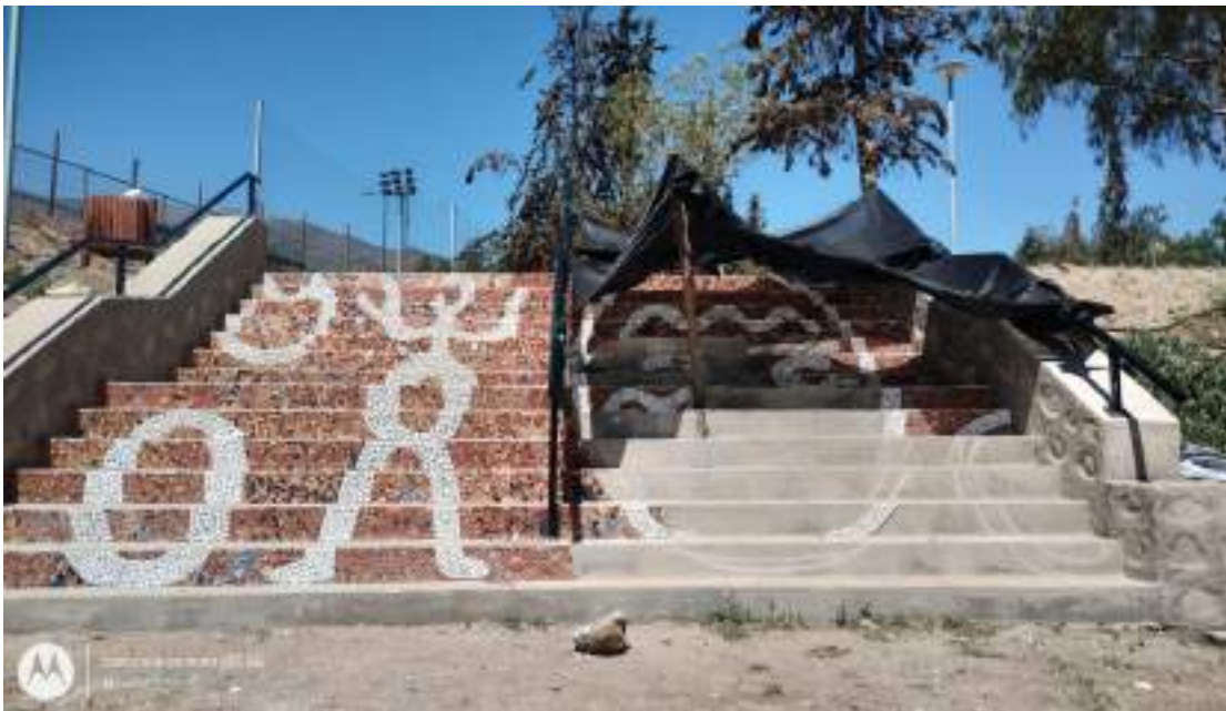
Figura 25: Construcción de mosaico de petroglifos antropomorfos en escalera de la localidad de Jorquera, Región de Coquimbo, Chile. Fotografía de Maritza Méndez, 2023.

De todas formas, la artista no tan solo desarrolla su trabajo visual mediante la realización de encargos de la corporación, sino que también produce obra para la venta y