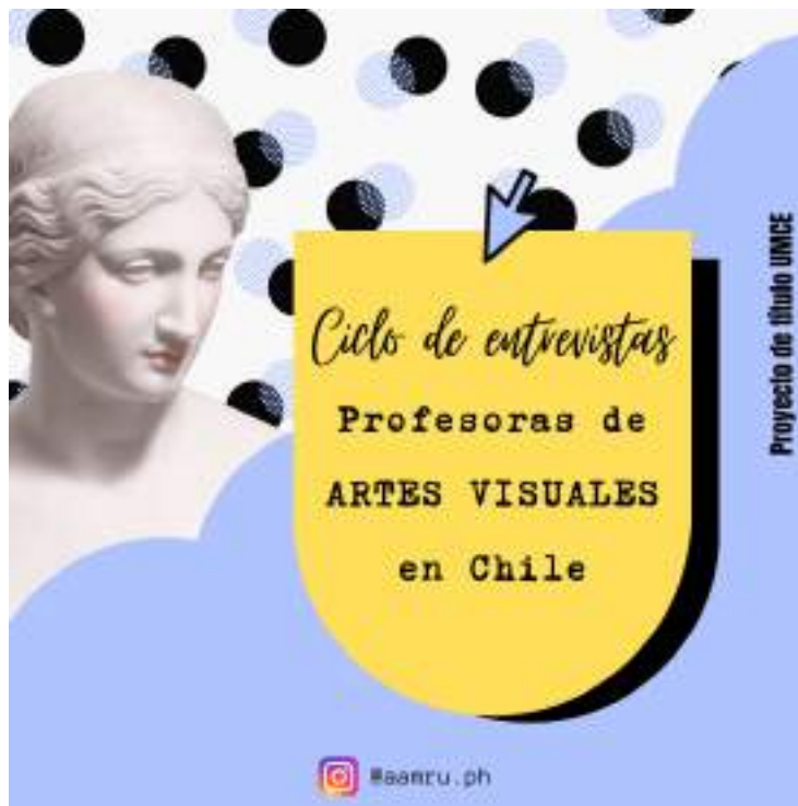
Figura 2: Afiche de “Ciclo de entrevistas a profesoras de Artes Visuales en Chile” publicado en redes sociales como Instagram y Facebook, a través del cual invité a profesoras de artes visuales a participar del ciclo de entrevistas durante octubre y noviembre del 2023.

En primer momento, tan solo realicé una publicación, pero al percatarme del contratiempo con Google Meet, decidí expandir esa convocatoria a Instagram y cree un afiche alusivo al “Ciclo de entrevistas. Profesoras de Artes Visuales en Chile” .