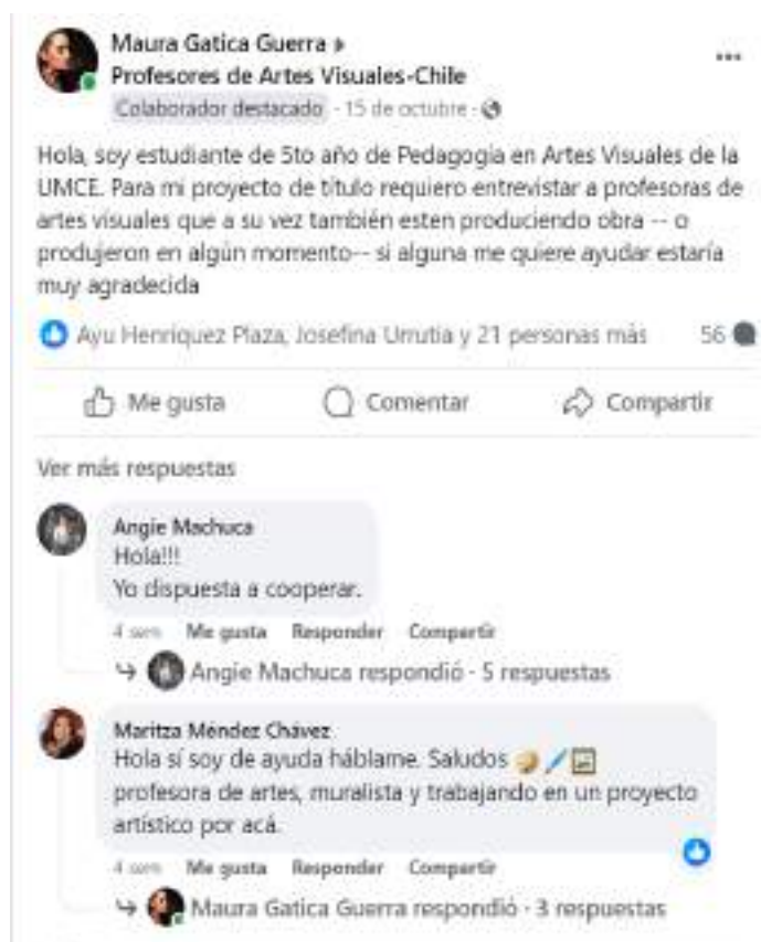
Figura 1: Llamado a entrevistas de profesoras de Artes Visuales a través de Facebook, en octubre del 2023.

Para convocar a las profesoras, se realizó una publicación en grupos de Facebook tales como “Profesores de artes visuales- Chile” ; “profesores de artes visuales” y “depto Artes Visuales PEDA OFICIAL” . Siendo los dos primeros en donde alcancé una mayor convocatoria.