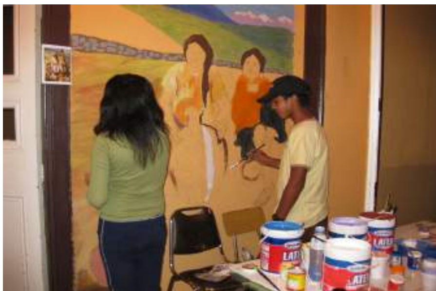
Figura 23. Taller de mural en Centro de Arte Municipal Salamanca, 2010.