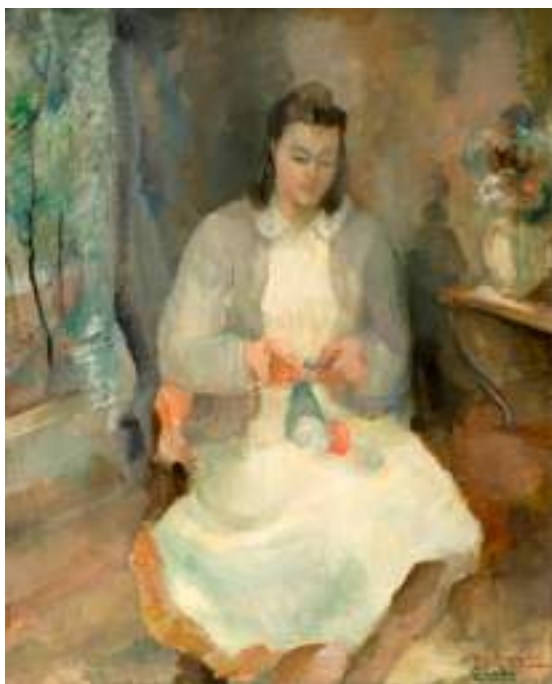
Figura 14. Ana Cortés, Niña tejiendo (s.f). [Pintura al óleo]. Pinacoteca Universidad de Concepción, Chile.