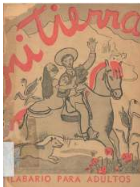
Figura 8. Portada Mi tierra: silabario para adultos , creado por Laura Rodig Pizarro en 1949.

Según Valdebenito (2020), Rodig se reincorpora a la pedagogía en 1942 y se desempeña como profesora en diversas regiones del país, incluso en sectores muy apartados como Juan Fernández y Magallanes. La docente se jubila en junio de 1951, sin embargo “su compromiso y deseo de aportar al país le hizo volver a colaborar con diferentes proyectos educativos, tanto en el sistema escolar a través de talleres de modelado y dibujo, como en diversos museos de Santiago durante la década de 1960” (Valdebenito, 2020, p.