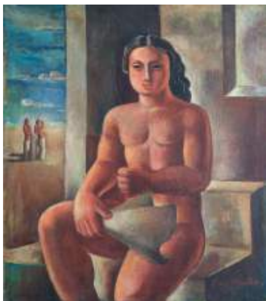
Figura 5. Desnudo de mujer (c.a 1937), de Laura Rodig. [Pintura al óleo]. Museo Nacional de Bellas Artes, Santiago, Chile.

Paralelo a sus aportes curatoriales y pedagógicos, Rodig no abandonaba la producción artística. El mismo 1937 presenta nuevamente la serie Tipos Mexicanos , en la Sala de Exposiciones del Banco de Chile, que da espacio a los marginados de los espacios artísticos. Allí en donde también expone la obra Desnudo de mujer , la cual representa a las disidencias de mujeres que deseaban a otras mujeres, en donde la artista desbarata el canon y la representación femenina al presentar a una mujer masculinizada (Cortés, 2020).