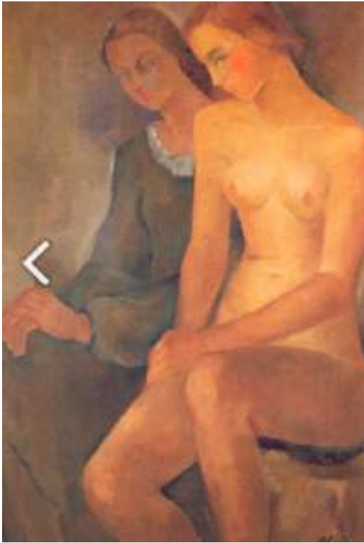
Figura 15. Ana Cortés, Rubor e Inocencia , (s.f). [Pintura al óleo]. Colección particular.

Aunque su forma de pintar y toda la revolución que significó Cortés para la pintura, se vincula gran parte de su desarrollo artístico con los pintores del Grupo Montparnasse o de la Generación del 28 . Sin embargo, con el derecho que la creación le concede, con los años sus temáticas se transformaron y transitó hasta la abstracción, siendo esta última línea la cual dio vida a sus pinturas hasta sus últimos días, pues “Ana Cortés pintó hasta los 100 años y murió el 5 de enero de 1998 cuando tenía 102 años de edad” (Arriagada, Pfeffer y Romero, 2015, p. 24).