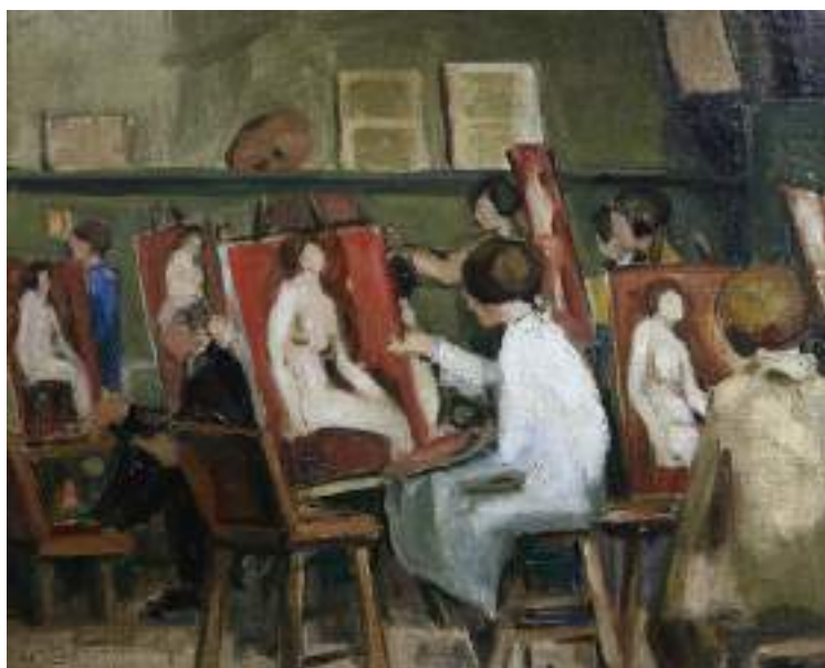
Figura 9. Ana Cortés, La Grande Chaumière . (1926). [Pintura al óleo]. Museo Nacional de Bellas Artes, Santiago, Chile.

Su acercamiento hacia el mundo de las artes se forjó desde su infancia. Ingresó a la Escuela de Bellas Artes de la Universidad de Chile en 1920, en donde es alumna de Juan Francisco González y Ricardo Richon- Brunet. En 1925 viaja a Francia para continuar con su formación en la Academia Grand Chaumiére ; la Academia Colarossi y en el Taller de André Lhote , importante figura del cubismo francés quien introduce a Cortés en el estudio de la estructura y la descomposición de las formas en la pintura (Museo Nacional de Bellas Artes). En su viaje estudia las ideas del “constructivismo cezanniano”, el cual plantea las teorías formales del cubismo, los elementos de expresión del lenguaje visual y las concepciones abstractas de la composición. Cortés se mantiene por tres años en Europa, donde toma estrecho contacto con el movimiento de vanguardia y la Escuela de París . Allí profundiza la investigación artística del cubismo y surrealismo, gran apuesta que significaba un gran riesgo en la época (Arriagada, Pfeffer y Romero, 2015).