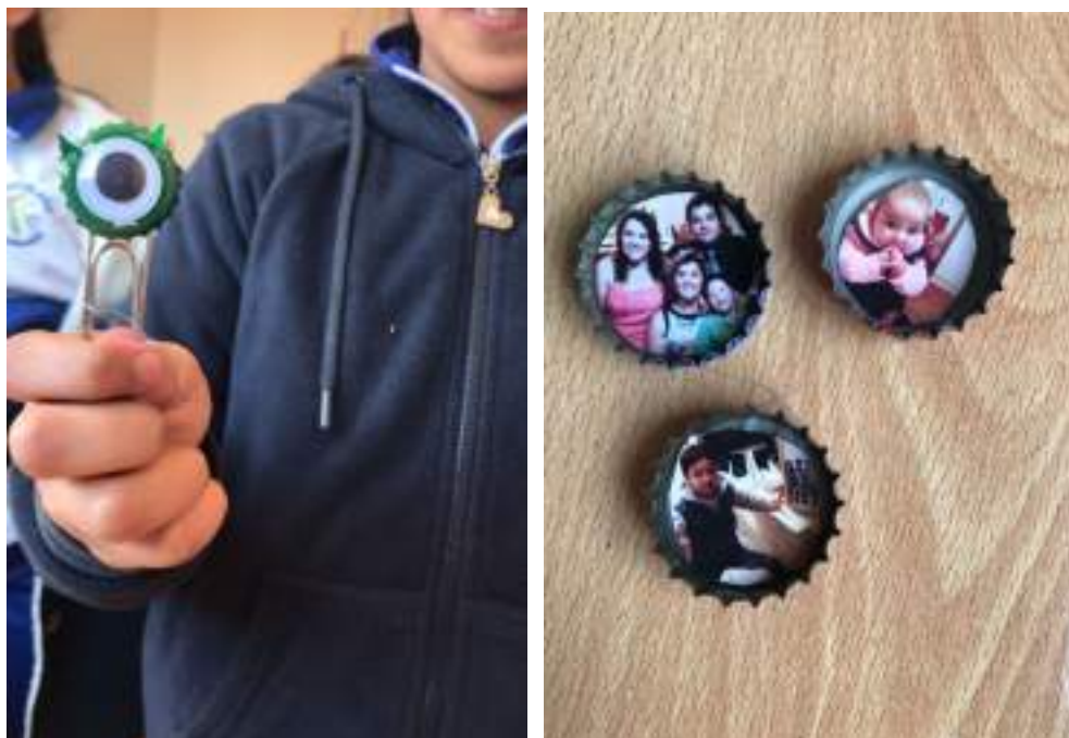
Figuras 27 y 28. Trabajos realizados por los estudiantes en los talleres extraprogramáticos impartidos por Irma Mellado, en 2019 en escuela de San Fernando.

grado de licenciada en 2019, paralelo a sus primeros acercamientos a la pedagogía, pues ese mismo año se desempeña como tallerista de en un colegio de San Fernando.