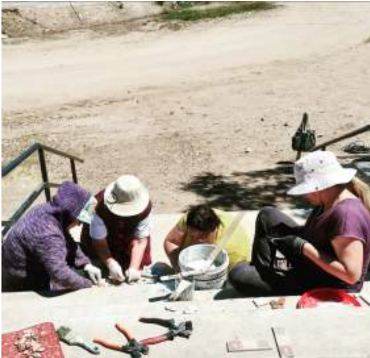
Figura 24. Proceso de construcción de mosaico a través del trabajo comunitario por parte del Centro de Arte Salamanca. Las integrantes del grupo construyen un mosaico en una escalera de la localidad de Jorquera, Región de Coquimbo.