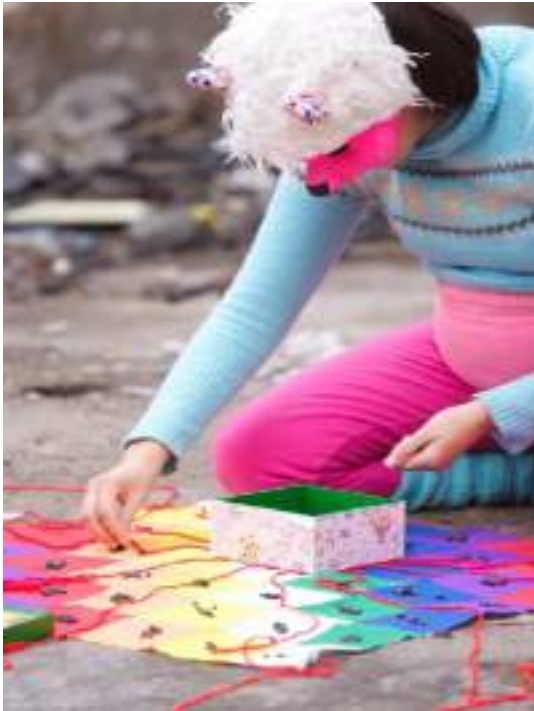
Figura 22. Karina Prudencio, Encuentro fractal, bienvenida. (2012). [Performance]. Santiago, Chile.