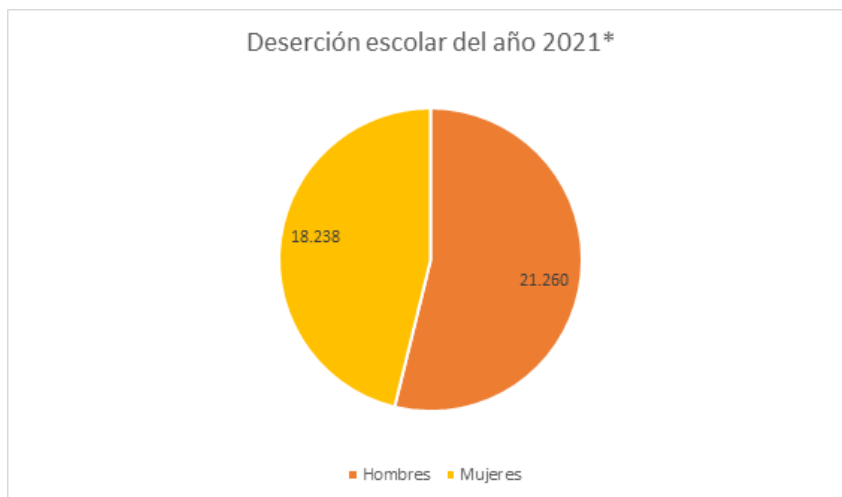
Gráfico n°3: “Deserción escolar año 2021”